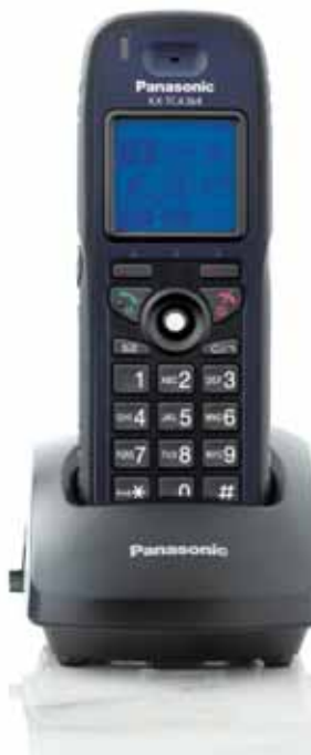
KX-TCA364 Robustes Business-DECT