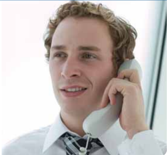
BROSCHÜRE ZU KX-TDE100/200/600