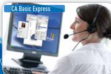
CA Basic Express