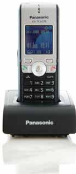
KX-TCA275 Kompaktes Business-DECT