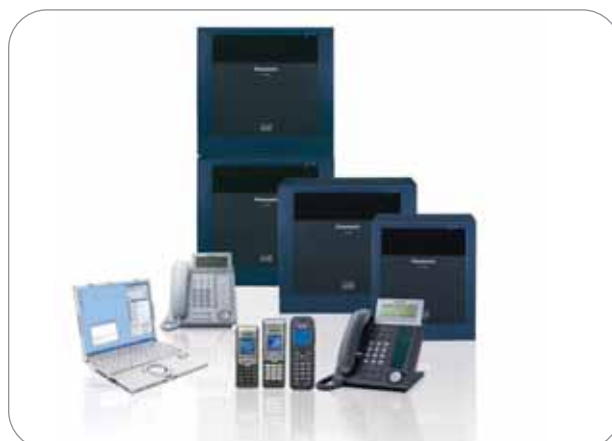
DIE KOMMUNIKATIONSPLATTFORMEN DER KX-TDE-SERIE

Konvergent, modular, erweiterbar, flexibel SIP-aktiviert und mit integrierter Unterstützung für Unified Communications-Produktivitätsanwendungen. Diese Attribute machen die KX-TDE-Serie zur optimalen Kommunikationsplattform für Kunden, um ihre heutigen und zukünftigen Geschäftskommunikationsanforderungen zu erfüllen, da sie Unified Communications mit umfassender IP-Telefonie vereinen. Diese Systeme wurden für einfache Installation und kostengünstigen Betrieb entwickelt und bieten dadurch einen schnellen ROI.