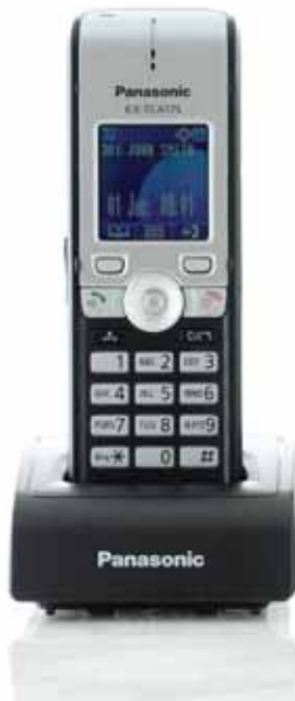
KX-TCA175 Standard- Business-DECT