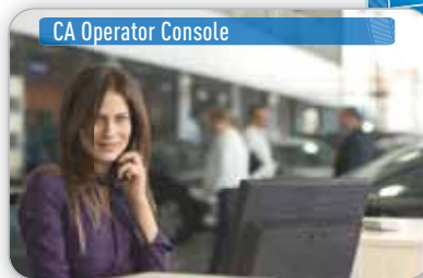
CA Operator Console

EMPFANGSMITARBEITER, DER KUNDENANRÜFE ENTGEGENNIMMT UND WEITERLEITET